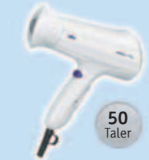
1 Haarfön Braun Creation