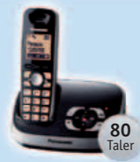
1 Panasonic Schnurlostelefon