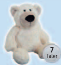
1 Eisbär Karlchen