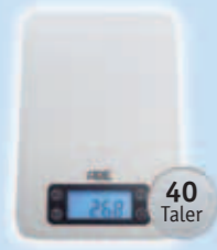
1 Digitale Küchenwaage