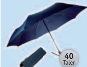
1 Taschenschirm Samsonite