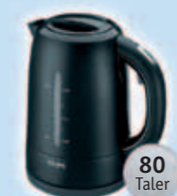
1 Krups Wasserkocher (Schwarz/Weiß)