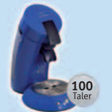
1 Senseo Kaffeemaschine