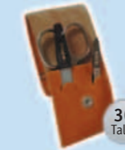
1 Nagelset mit Lederetui