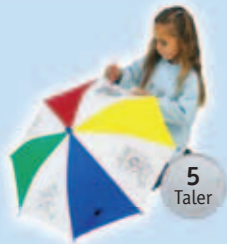
1 Kinderschirm zum Bemalen