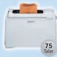
1 Krups Toaster (Weiß/Schwarz)