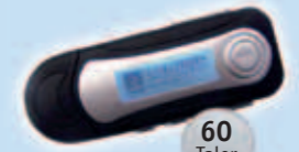
1 MP3 Player (Abbildung ähnlich)