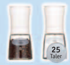
1 WMF Pfeffer oder Salz Mühle