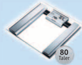
1 Beurer Glas-Diagnosewaage