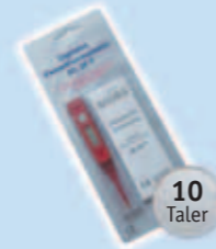
1 Digitales Fieberthermometer